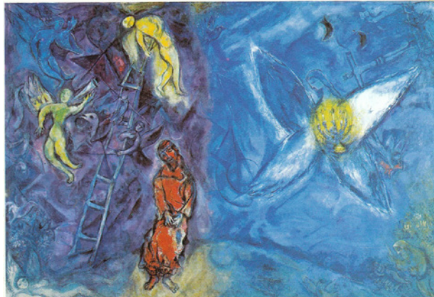
Jacob's ladder, Marc Chagall